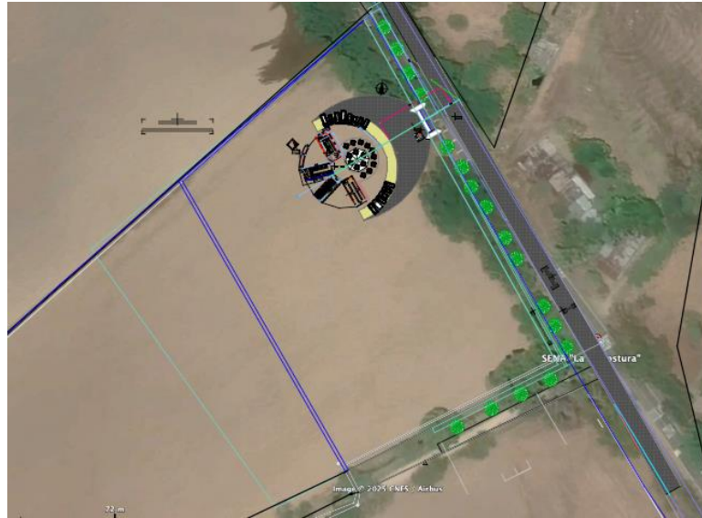
Ilustración 3. Localización.