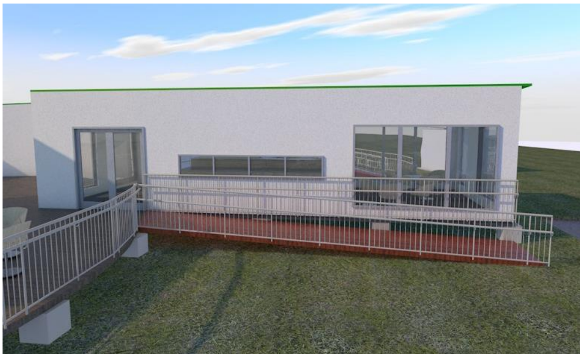
Ilustración 1. Imagen ilustrativa en 3D del ambiente

Ambiente no Convencional, tipo contenedor marítimo, conformado por dos (2) containers HIGH CUBE de 40 pies unidos longitudinalmente y con todas las especificaciones técnicas de recubrimiento, iluminación, cableado estructurado, instalaciones eléctricas de energía regulada y comercial según la normatividad vigente, puntos de conexión hidráulica, sanitaria, puertas, ventanas y climatización artificial.